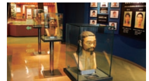
「宜野湾市立博物館」 http://museum-okinawa.jp/29ginowan