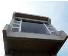
[D' spec] www.dspec.jp

にラウンジ気分でおいしいお酒を飲むことができる。リビングの一面が大きなガラス張りならば、日々の動線に海が見える。など、少し特別な特徴があって、プラス海が近い物件をセレクトしています。海の近くは塩害が…と気にしていたのは昔の話で、今の車はペイント技術が良くなって、そう簡単に愛車が錆びたりしないそう。願わくは、海に近くてちょっと素敵な物件が増えるように。