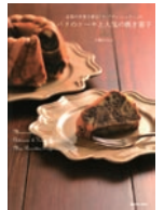
『パリのケーキと人気の焼き菓子』マルブルトン