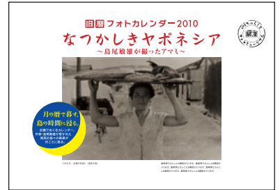
旧暦フォトカレンダー2010「なつかしきヤポネシア」 ～島尾敏雄が撮ったアマミ～ NPOちゅらしまフォトミュージアム TEL 090-8293-5597 www.churaphoto.jp

その使いづらさが魅力的!と評判のカレンダー(笑)。このカレンダーを眺めると、月の満ち欠けなど自然のリズムを感じながら、ひと時のんびりした気分を味わえます。カフェユニゾンで店頭販売している他、NPOのホームページでも注文を受け付けています。