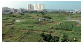
リゾートホテルの目前に広がる畑。畦道は、子供たちや買い物帰りの人も行き交う