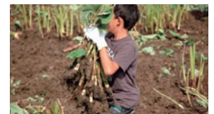
「ハルサー体験教室」の情報はここでチェック。www.futenma-champloo.com