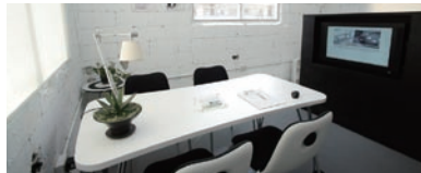
奥の小部屋はこんな感じ

Okinawa Real Estate Library (沖縄不動産文庫) HP www.dspect.jp