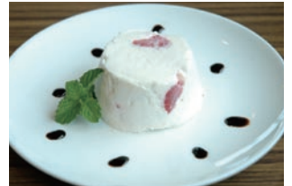
イチゴとチーズのアイスクーキー

●カフェでは、9月いっぱいまで夏らしいドリンクとデザートをご用意しました。●まずは、「カモミールレモネード」(450円)。ハーブティーとレモネードの組み合わせで、癒されつつ、体をクールダウン。女性におすすめです。●続いて、「ヴァージンモヒート」(450円)。本来モヒートとは、ミントをたっぷり入れてラムで割ったカクテル。ユニゾンではノンアルコールでカクテル風に仕上げてあります。シャキッ!としたいときに。●そしてスイーツは、「イチゴとチーズのアイスクーキー」(450円)。イチゴの果肉とクリームチーズで作った濃厚な手づくりアイスクリームです。バルサミコ酢ソースとともに。暑い午後涼みに来てくださいな。